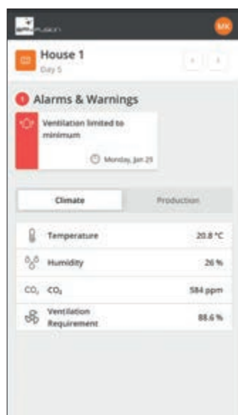
Alarmas en la aplicación BFN Fusion